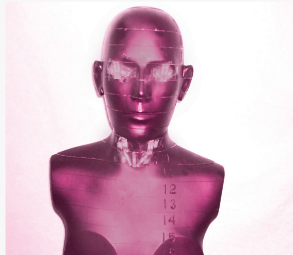
شکل ۲: فانتوم راندو دزیمترها روی ناحیه تیروئید و چشم‌ها قرار گرفته‌اند.

برای تعیین پرتوگیری پوست ضمن اسکن سر، چند دزیمتر در محل پیشانی، گونه‌ها و پشت سر روی ناحیه استخوان پس سری قرار داده شد. برای تعیین پرتوگیری پوست ضمن اسکن از ناحیه شکم و لگن، ۱۲ قطعه چیپس روی محور Z از برش شماره ۱۹ (روی زائده زایفوئید استخوان جناغ سینه) تا برش شماره ۲۹ به ترتیب در امتداد یکدیگر و وسط هر برش قرار داده شد. همچنین وسط برش شماره ۲۵ نیز تعداد ۴ عدد چیپس قرار داده شد تا پرتوگیری پوست در نواحی مختلف ضمن اسکن شکم و لگن تعیین گردد (شکل ۲).