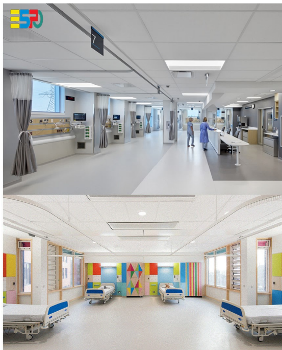
تصویر ۲- بالا، ترکیب رنگ های استفاده شده در سطوح داخلی اورژانس- تصویر پایین، ترکیب رنگ های استفاده شده در بخش ریکاوری.