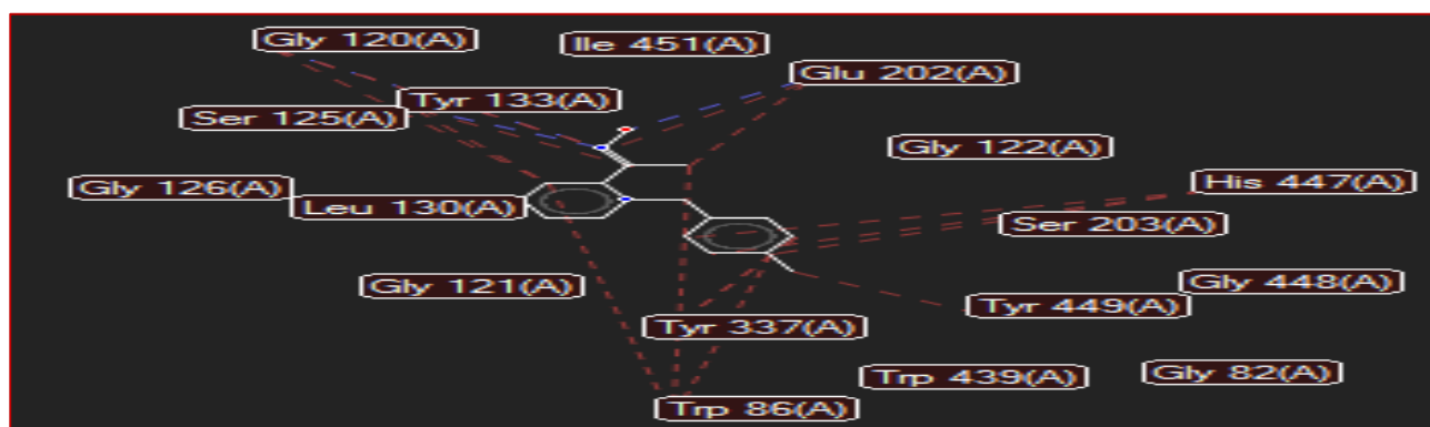
شکل ۲- بررسی رزیدوهای (آمینواسیدهای) درگیر در تشکیل پیوند آنزیم با ترکیب شماره ۹ توسط نرم‌افزار مولگرو (MVD): همان‌طور که در شکل مشخص است این ترکیب با آمینواسیدهای Glu ۲۰۲، Tyr ۱۳۳، Gly ۱۲۰، Tyr ۱۳۳ پیوند هیدروژنی (خط چین آبی‌رنگ) و با آمینواسیدهای Trp۸۶، His۴۴۷، Tyr۳۳۷، Tyr۴۴۹، Glu ۱۲۰، Tyr ۱۳۳ در تشکیل پیوند هیدروفوبی (خط چین قرمز رنگ) شرکت می‌کند.

نتایج این بررسی‌ها نشان داد که مشتقات مورد مطالعه می‌توانند با اتصال به جایگاه فعال آنزیم استیل کولین استراز انسانی موجب فعال‌سازی مجدد آن گردند. نتایج داکینگ مشخص نمود که تمامی ترکیبات مورد مطالعه عملکرد خوبی داشته و انرژی پیوندی قابل قبولی دارند. مطالعات داکینگ نشان می‌دهد، ترکیب شماره ۹ (ترکیب حاوی ۴- متیل بنزیل) با انرژی